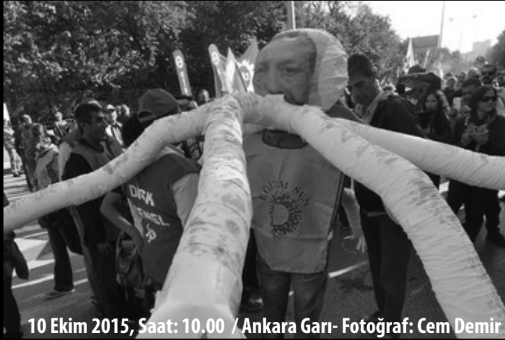
10 Ekim 2015, Saat: 10.00 / Ankara Garı