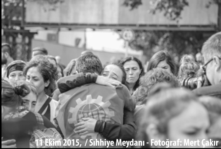
11 Ekim 2015, / Sıhhiye Meydanı