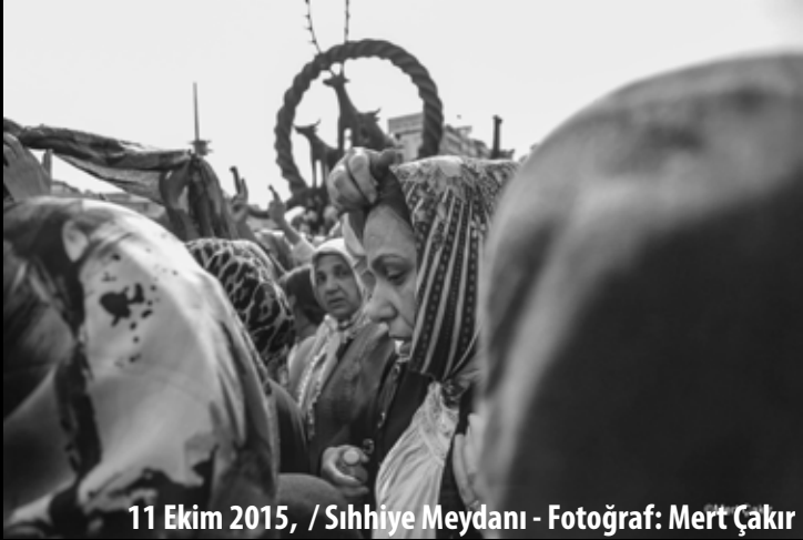
11 Ekim 2015, / Sıhhiye Meydanı