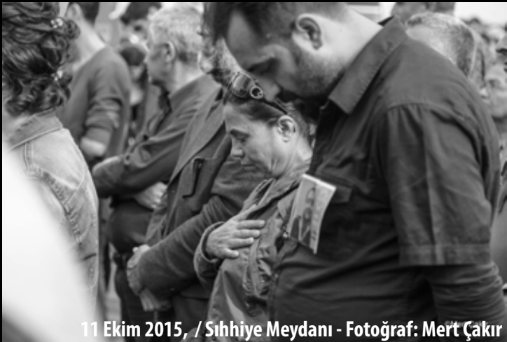
11 Ekim 2015, / Sıhhiye Meydanı