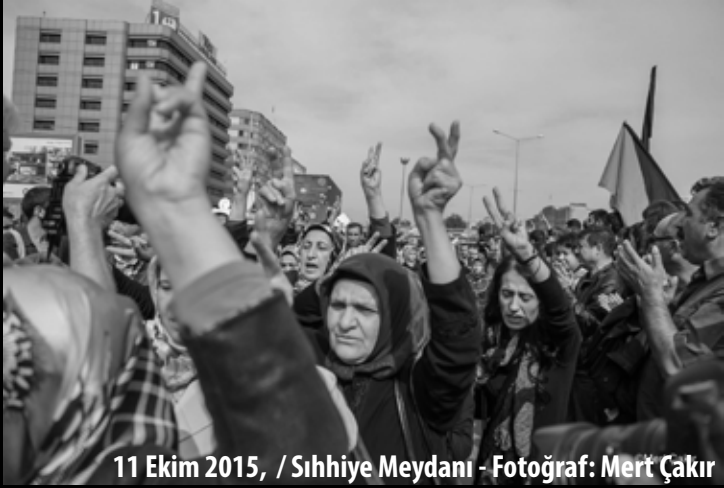
11 Ekim 2015, / Sıhhiye Meydanı