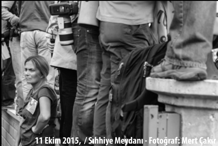
11 Ekim 2015, / Sıhhiye Meydanı