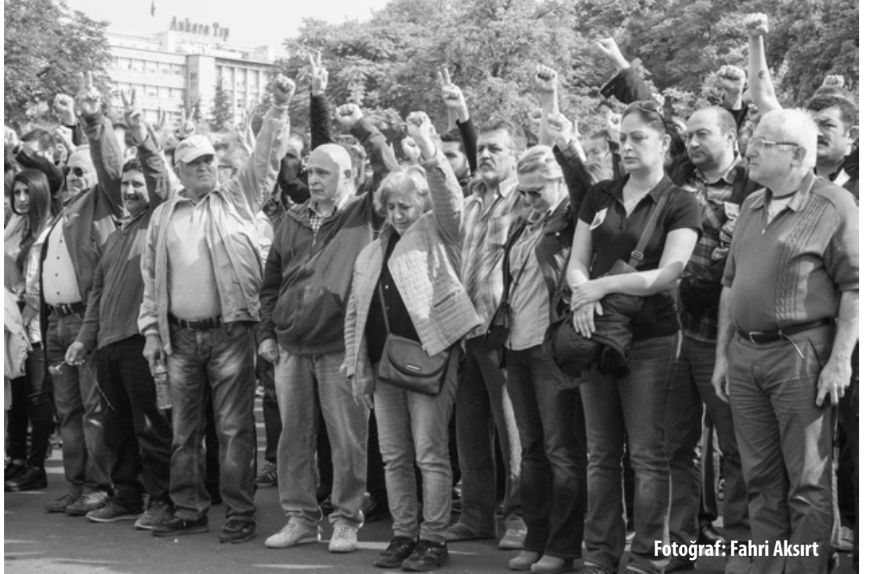
Katliamdan bir gün sonra, 11 Ekim'de onbin kiřilik bir kalabalık, anma töreni için Sıhhiye Meydanındaydık.