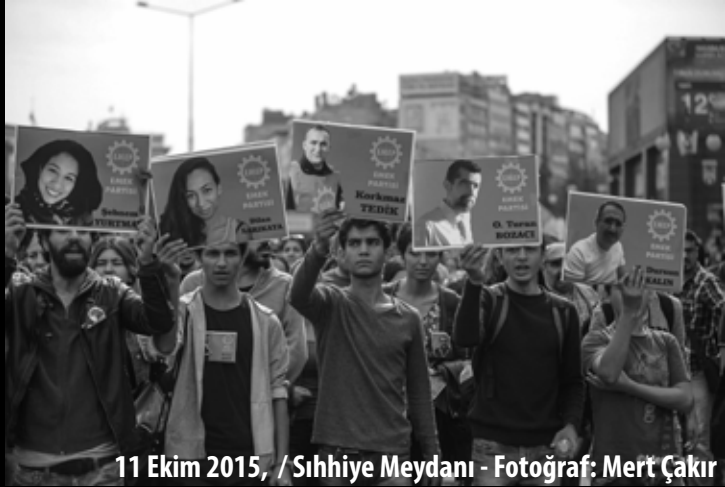
11 Ekim 2015, / Sıhhiye Meydanı - Fotoğraf: Mert Çakır