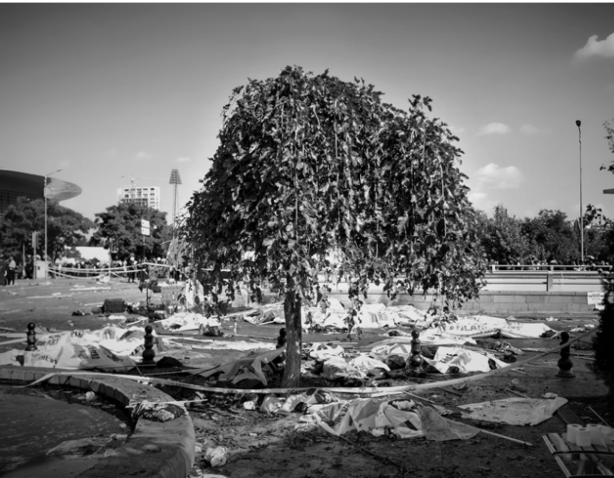
Kompozisyon: Alper Fidaner, Orhun Bora Çetin