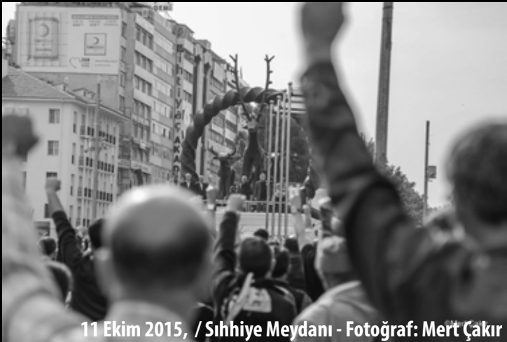
11 Ekim 2015, / Sıhhiye Meydanı