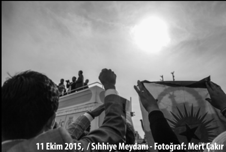
11 Ekim 2015, / Sıhhiye Meydanı - Fotoğraf: Mert Çakır