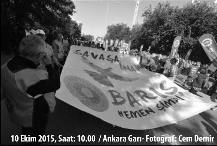
10 Ekim 2015, Saat: 10.00 / Ankara Garı