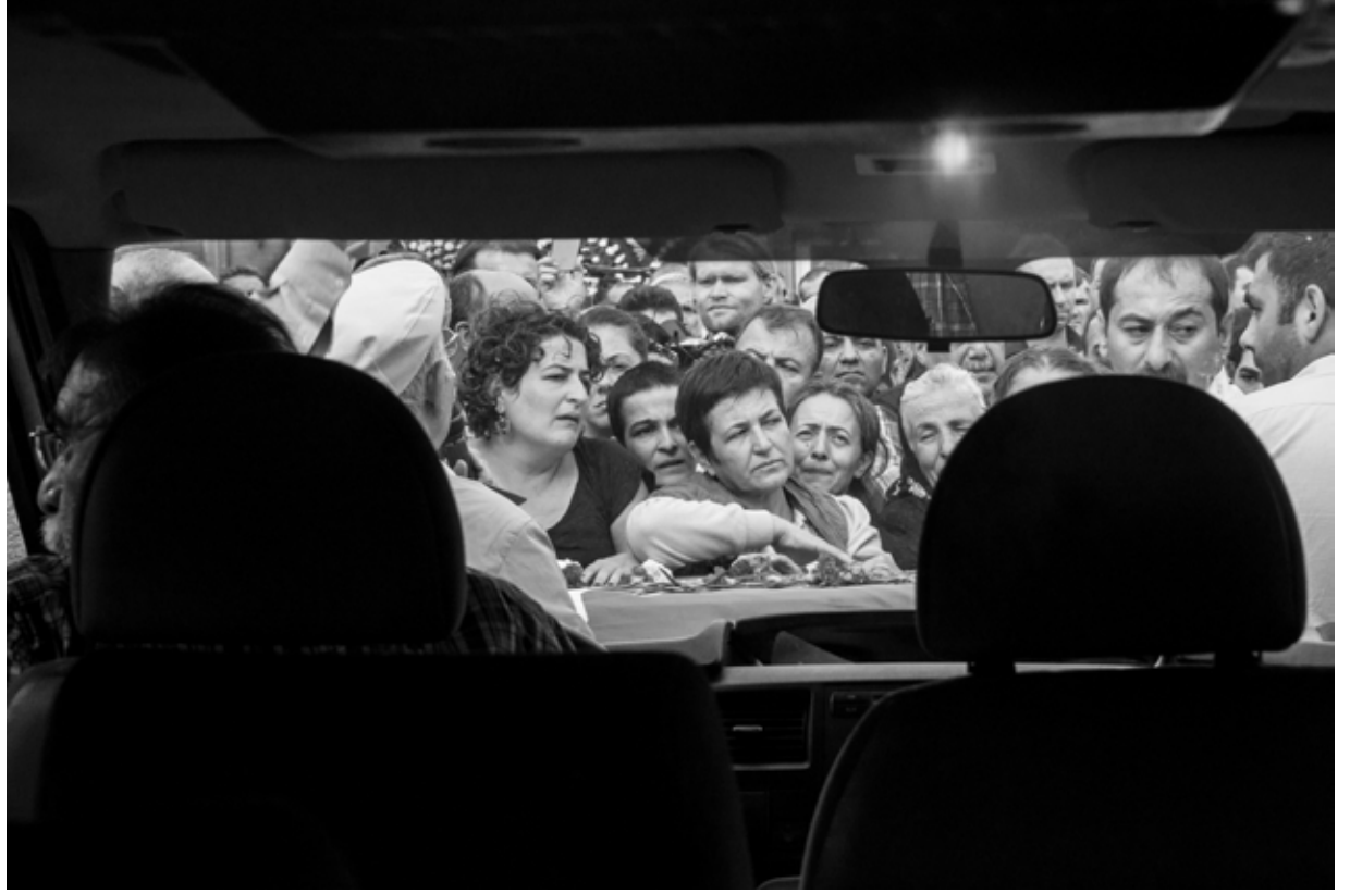
Yařamları ellerinden alınan dostlarımızı 11 Ekim'den itibaren göz yaşlarıyla uęurladık.